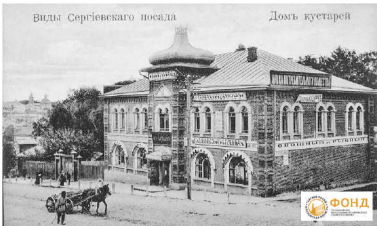
Открытка начала XX века