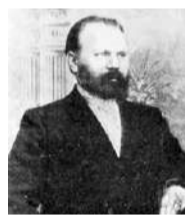
Я. Д. Солдатов (из «Издания в память 300-летия царствования державного дома Романовых», 1914 г.)

Московский справочник «Вся кинематография» 1916 года также включает информацию об электротheaterе. В том же 1916-м газета «Коммерсантъ» сообщила о продаже «Модерна» О. М. Синицыной купцу Я. Д. Солдатову, ставшему последним дореволюционным владельцем.